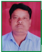
బెండ్ర శ్రీనివాస్ సంగారెడ్డి బ్యూరో

అర్ధరాత్రి దాటింది. ఊరు ఊరంతా గాఢనిద్రలో జోగుతున్నట్టుంది. ఎక్కడా ఎలాంటి అలికిడి లేదు. కానీ ఏదో పెద్ద ప్రమాదమే ముంచుకురాబోతున్నట్లు కుక్కలు ఒక్కతీరుగ శోకం పెట్టి ఏడుస్తున్నాయి. ఇంటి అరుగు మీద పడుకున్న మైసవ్వకు ఎంత ప్రయత్నించినా కునుకు రావడం లేదు. నిద్రపోయేందుకు ఎంత గింజులాడుతున్నా కంటిరెప్ప కూడా మూతపడట్లే.