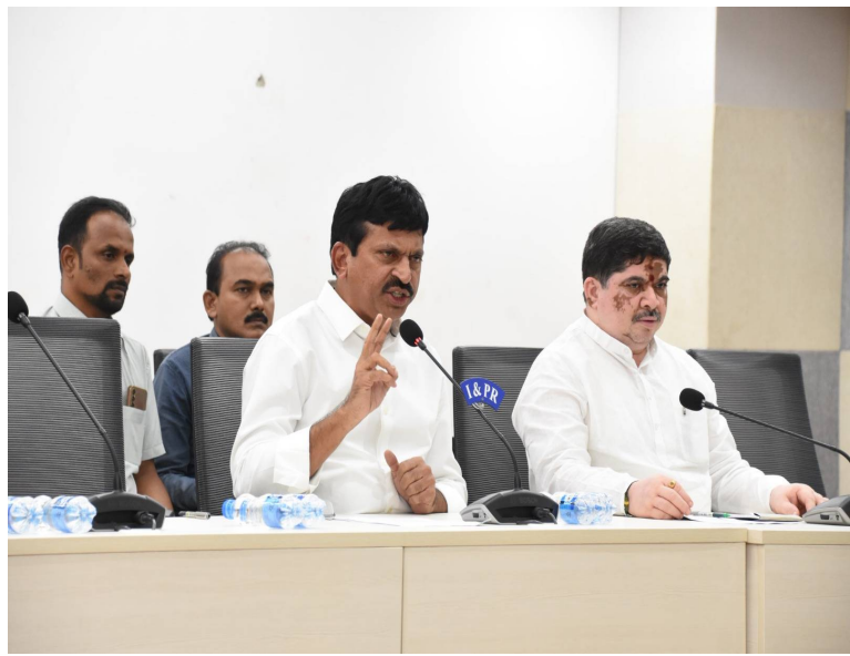
హైదరాబాద్, అక్టోబర్ 27 : రాష్ట్ర ప్రభుత్వ ఉద్యోగులకు ఒక డీఎం ఇవ్వాలని మంత్రిమండలి నిర్ణయించింది. డాక్టర్ బీఆర్ అంబేద్కర్ సచివాలయంలో ముఖ్యమంత్రి రేవంత్ రెడ్డి గారి అధ్యక్షతన సుధీర్ఘంగా జరిగిన రాష్ట్ర మంత్రిమండలి సమావేశం పలు

నిర్ణయాలు తీసుకుంది. రాష్ట్ర ఆర్థిక పరిస్థితులను దృష్టిలో ఉంచుకుని డీపావళి పండుగ సందర్భంగా ఒక డీఎంను విడుదల చేయాలని మంత్రివర్గం తీర్మానించింది. హైదరాబాద్ లో మెట్రో రైలు రెండో దశ విస్తరణకు సంబంధించిన డీపీఆర్ కు మంత్రివర్గం ఆమోదించింది. నాగోల్ - శంషాబాద్, రాయదుర్గం - కోకాపేట్, ఎంజీబీఎస్ - చాంద్రాయణగుట్ట, మియాపూర్ - పటాన్ చెరు, ఎల్ బీ నగర్ - హయాత్ నగర్ మొత్తం 76.4 కిలోమీటర్ల మేరకు విస్తరణ చేపట్టాలని మంత్రిమండలి నిర్ణయించింది. కేంద్ర రాష్ట్ర ప్రభుత్వాల భాగస్వామ్య విధానంలో చేపట్టే మెట్రో రైలు రెండో దశ ప్రాజెక్టు కోసం రూ. 24,269 కోట్లతో ప్రతిపాదనలతో సిద్ధం చేసిన డీపీఆర్ ను కేంద్రానికి నివేదించాలి. జీవో 317 కు సంబంధించి మంత్రివర్గ ఉపసంఘం సిఫారసుల మేరకు ఉద్యోగుల మెడికల్, స్పాజ్, మ్యూజువల్ బదిలీలకు ఆమోదం. జీవో 46 కు సంబంధించి కీలకమైన స్థానికత అంశం రాష్ట్రపతి పరిధిలో ఉన్నందున న్యాయ సలహా తీసుకుని శాసనసభలో చర్చించిన తర్వాత నిర్ణయం. రాష్ట్రంలో నవంబర్ 31 వరకు కుల, ఆర్థిక, సామాజిక గణన సర్వే పూర్తి చేయాలి. ఇందుకోసం 80 వేల మంది ఎన్యూమరేటర్లను నియమించి నవంబర్ 4 నుంచి 19 వరకు రాష్ట్రమంతా ఇంటింటి సర్వే చేపడుతారు. రాష్ట్రంలో పంచాయతీ రాజ్, ఆర్ అండ్ బీ పరిధిలో