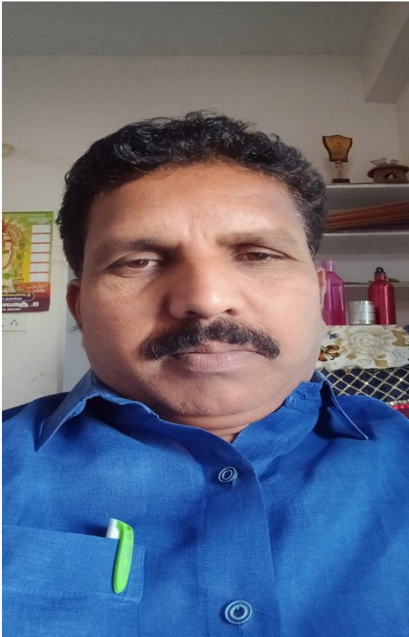
- యావత్ తెలంగాణ రాష్ట్ర బైండ్ల బంధువులకు మరియు కులస్తులకు తెలియజేయునది ఏమనగా.....

- మన తాతలు, ముత్తాతలు మరియు మన పూర్వీకులు అందరూ కులవృత్తినే నమ్ముకొని ఉండడం వలన ఎక్కడ వేసిన గొంగడి అక్కడే ఉంది అంటే ఎలాంటి అభివృద్ధి చెందలేదు ( విద్యాపరంగా, ఉద్యోగ పరంగా, రాజకీయం పరంగా, అర్థికంగా & సామాజికంగా) వాళ్ళు జీవితాంతం పేదవారిగానే ఉండిపోయారు.