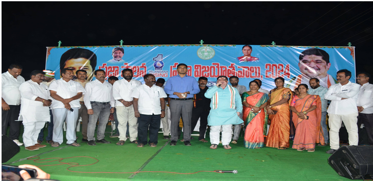
హుస్సాబాద్, నవంబర్ 24 ( మెతుకు సీమ న్యూస్ )